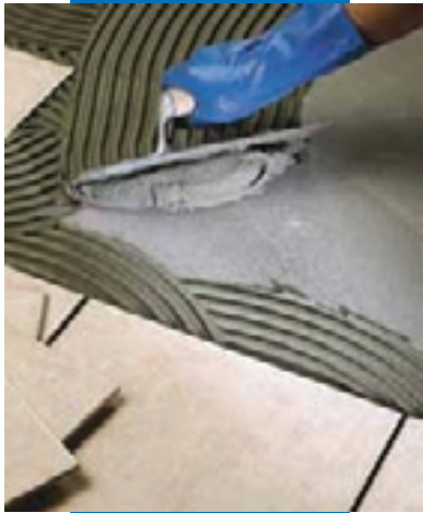
Укладка плитки ординарного обжига в качестве полового покрытия