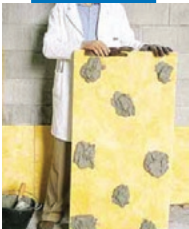
Клеевое крепление изоляционных панелей на неотделанную стену

Список значимых объектов, где использовался данный материал, предоставляется по требованию.