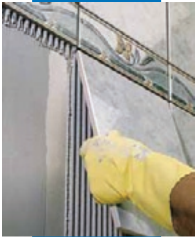
Укладка плитки ординарного обжига в качестве стенового покрытия поверх гипсовых панелей