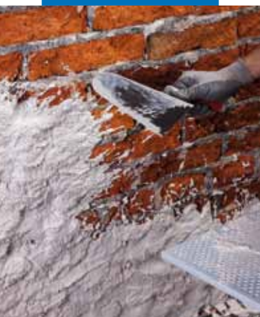
Нанесение Mape-Antique Rinzafo