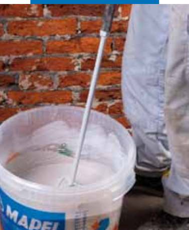
Приготовление Mape-Antique Rinzafo