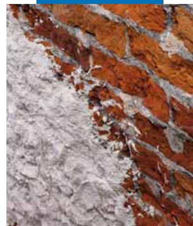
Укрупненный вид Mape-Antique Rinzaffo