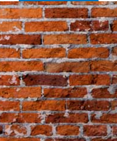
Кирпичная стена после удаления разрушившейся штукатурки