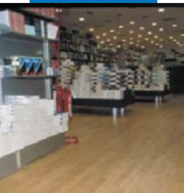
Пример укладки дерева поверх выравнивающей массы Ultraplan. Музыкальный магазин «Мессаджерие Музикали» - Рим - Италия