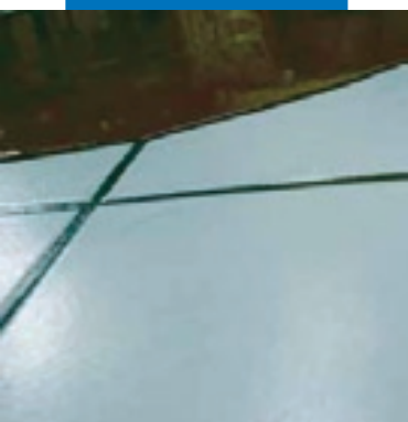
Деталь применения Ultraplan на строящемся керамическом полу после предварительной обработки составом Mapeprim SP