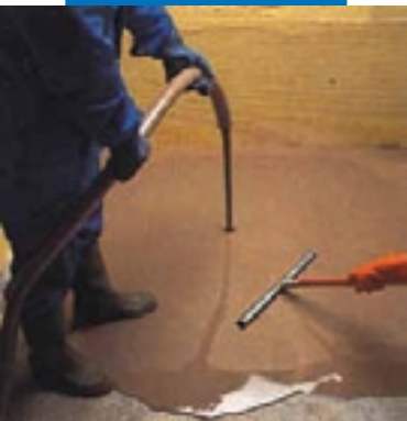
Нанесение Ultraplan насосом с последующей обработкой скребком