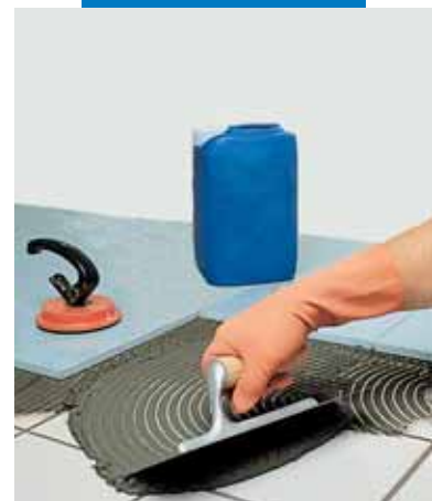
Укладка агломерата поверх имевшейся керамической плитки с использованием серого Granirapid