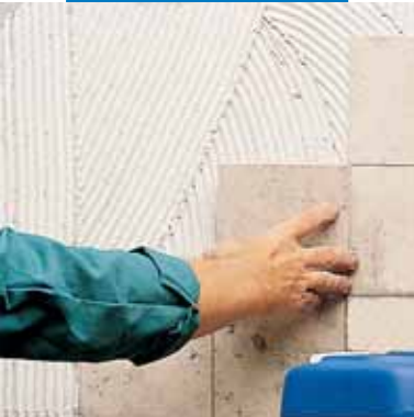
Укладка юрского мрамора с помощью белого Granirapid