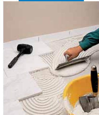
Укладка белого каррарского мрамора с помощью серого Granirapid