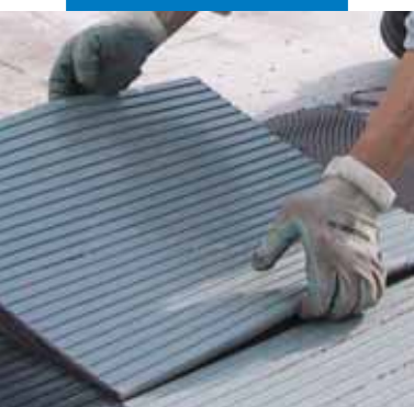
Укладка резиновой плитки с профилированной тыльной стороной с помощью клея Granirapid

древесные агломераты, асбестоцемент и пр.);