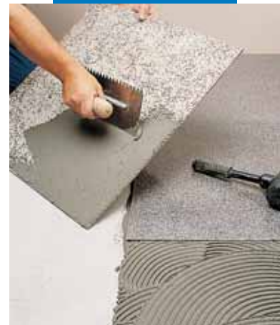
Укладка эластичного синтетического гранита с помощью серого Granirapid