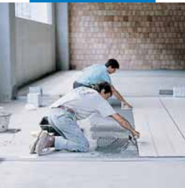
Укладка фарфоровой неглазурованной плитки в промышленных помещениях