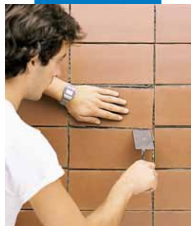
Время корректировки плитки – до 60 минут