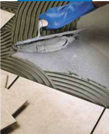
Укладка плитки ординарного обжига в качестве полового покрытия