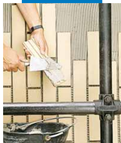
Укладка обшивки снаружи Прим.: Хорошо заполнять клеем заднюю поверхность обшивки