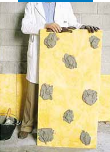
Клеевое крепление изоляционных панелей на неотделанную стену

Список значимых объектов использования данного материала доступен по требованию