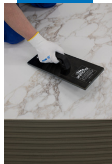
Укладка керамогранита размером 240 x 120 см.