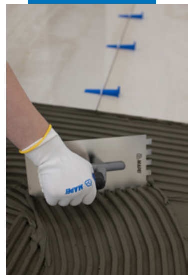
Укладка на пол керамогранита размером 160 x 80 см

В случае сильно впитывающих оснований и высоких температур рекомендуется смочить основание или применить соответствующую грунтовку перед нанесением Ultraflex S2 , чтобы продлить открытое время клея.