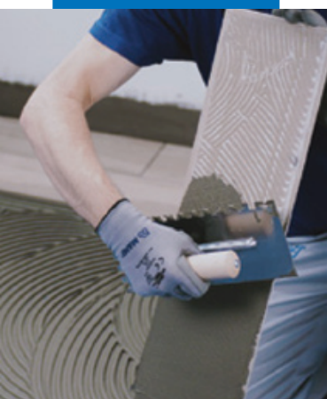
Укладка керамической плитки или камня на подходящий клей MAPEI класса не ниже C2