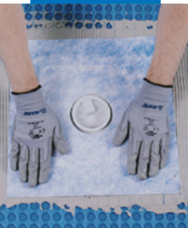
Гидроизоляция дренажных отверстий Drain Vertical/Drain Lateral