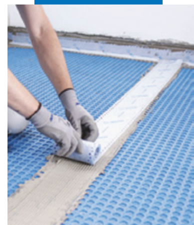
Гидроизоляция швов между листами с помощью Mapeband Easy на Mapeguard WP Adhesive