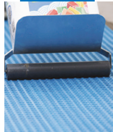
Прикатывание Mapeguard UM 35