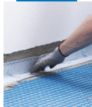
Гидроизоляция по краям с помощью Mapeband Easy на Mapeguard WP Adhesive