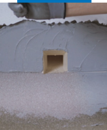
Гидроизоляция дренажных отверстий Drain Front