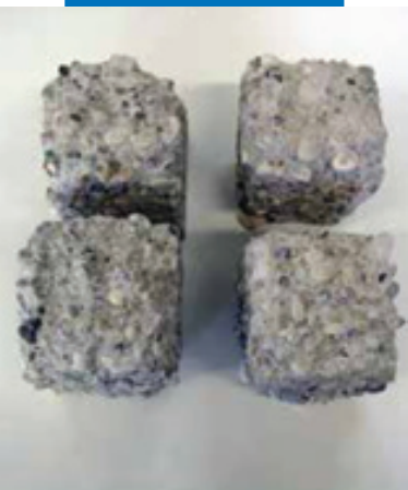
Потеря веса необработанных образцов после воздействия циклов замораживания/оттаивания.

Planiseal WR 90 Gel поставляется готовым к использованию и не должен разбав-