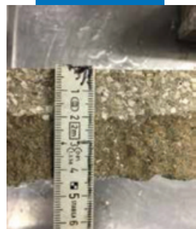
Глубина проникновения Planiseal WR 90Gel