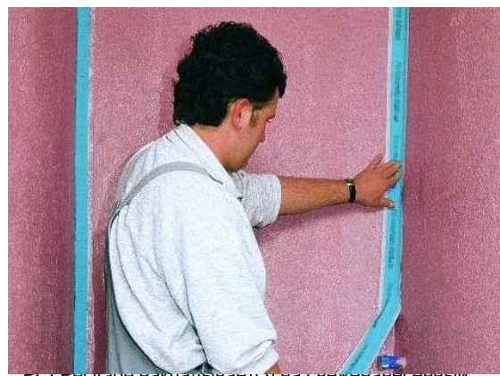
PCI Pецитаре накладывается на свеженанесенный слой герметика.