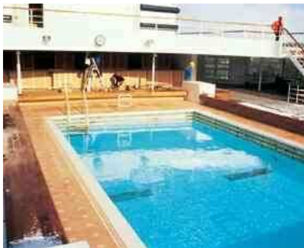
Керамическое покрытие на корабле, уложенное при помощи PCI Collastic.

Специальный контактный плиточный клей для стальных и полиэфирных оснований